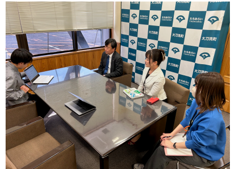
地方の交通問題解決のため、 町役場（町長）にプレゼン