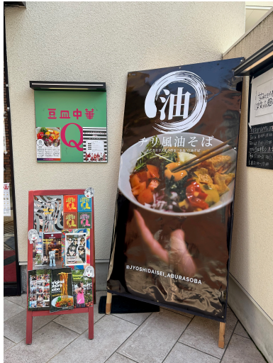
空き店舗活用で 油そばの企画・開発・販売