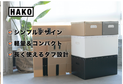
企業のSNSマーケティング戦略の 支援