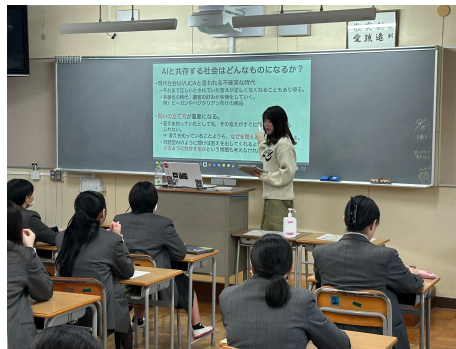
ChatGPTを活用した ビジネス教育プログラムの開発