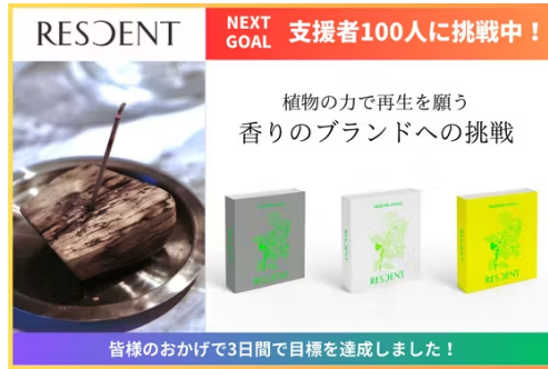
佐賀を代表するスタートアップ企業の クラウドファンディング支援